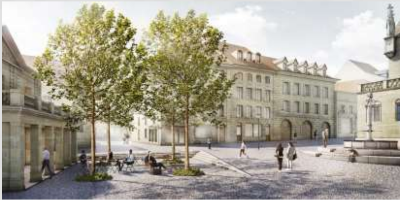
Place Sainte Catherine