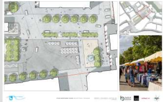
Notre Dame la Grenette